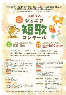
第 22 回作品募集チラシ

*小・中・高校の児童・生徒を対象とした短歌作品の応募要項を策定(チラシ印刷)して募集(学校・短歌団体単位の応募:1 人 1 首)した。(募集期間:令和 6 年 11 月 15 日から同 7 年 1 月 10 日まで)