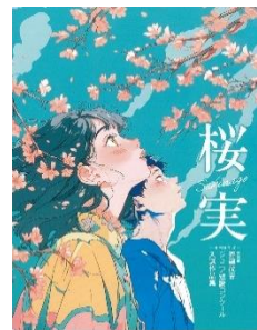
第 22 回入選作品集「桜実」